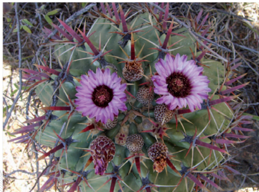
Biznaga ( Ferocactus recurvus )