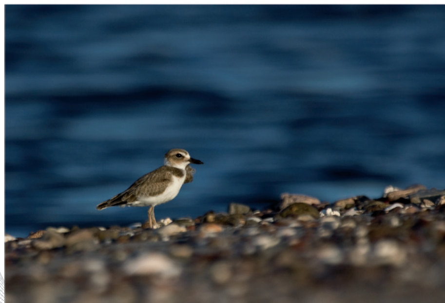
Chorlo de pico grueso ( Charadrius wilsonia )