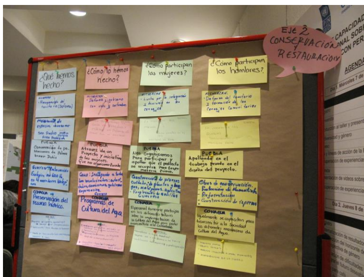
Foto: Capturar diversas voces. Eje 2: Conservación y restauración

De manera aleatoria se formaron seis mesas de trabajo. Las facilitadoras del taller y personal de la CONABIO facilitaron esta actividad utilizando la Guía 2: “El presente” (Anexo V). Se trabajó con la técnica de carrusel y la elaboración de en 6 matrices (una por cada eje de la ENBioMEX) en las cuales se plantearon las siguientes preguntas: ¿Qué hemos hecho? ¿Cómo lo hemos hecho? ¿Quiénes participan en las actividades? ¿Qué hacen las mujeres y qué hacen los hombres? Cada persona identificó una acción significativa de manejo/conservación de la biodiversidad que desarrollara en su organización y/o comunidad y entidad federativa. Se utilizaron tarjetas de colores para cada pregunta y al final se hizo una reflexión grupal de los resultados.