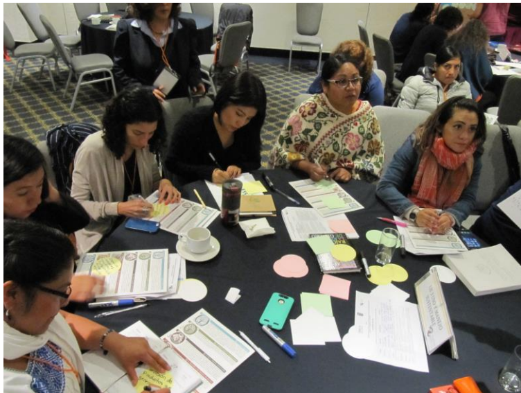
Fotos: trabajo individual y colectivo. Identificar prioridades para fortalecer capacidades

En las mesas de trabajo dos conceptos tuvieron especial presencia: la educación ambiental y los ordenamientos territoriales comunitarios . El fortalecimiento de capacidades en estos dos temas puede tener un impacto positivo en cada uno de los ejes y abarca los distintos ámbitos de capacidades incluidos en el taller, ya que requieren, conocimiento, organización y participación y se relacionan con el uso, la conservación, la restauración, los factores de presión, la incidencia en políticas, el acceso a financiamiento y la necesidad de desarrollarse con perspectiva de género e interculturalidad para lograr todo su potencial.