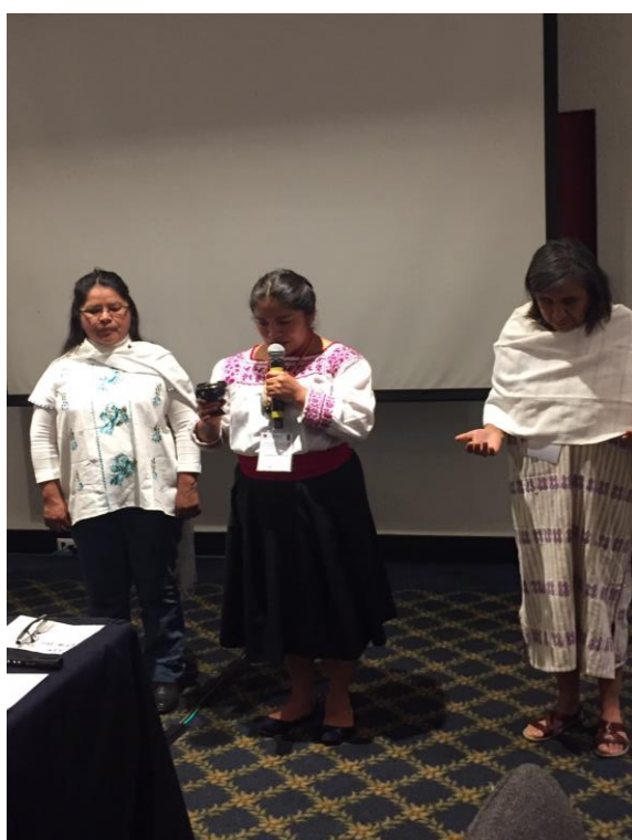
Foto: Ceremonia ancestral inaugural

Para dar inicio al taller se realizó una ceremonia ancestral, propuesta y coordinada por participantes de Puebla, Guerrero y el Estado de México. En la ceremonia se agradeció a la naturaleza por ser fuente de vida a través de los recursos que brinda a la humanidad: agua, plantas, animales. El grupo orientó su vista y atención a cada uno de los cuatro puntos cardinales para tener un momento de meditación y toma de conciencia y recordar la importancia de los recursos naturales para la vida material y espiritual. A través de esta sencilla ceremonia se fortaleció un ambiente de respeto para enmarcar las actividades del taller.