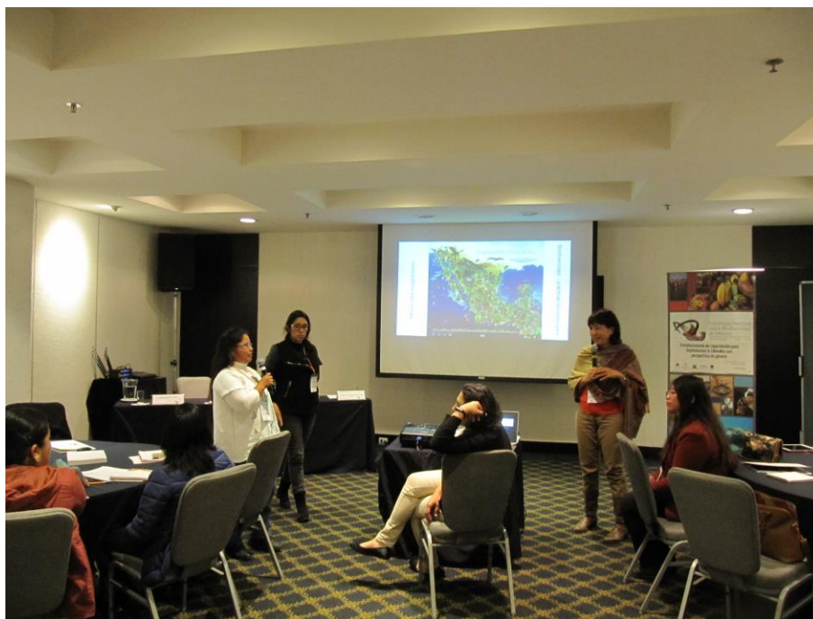
Foto: presentación sobre el CDB y su Plan de Acción de Género. Sesión de preguntas y respuestas.