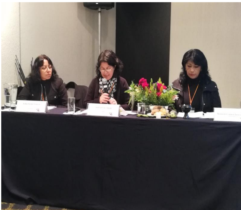
Foto: Mensajes inaugurales