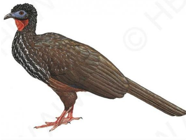
Imagen 1. Cojolita ( P. purpurascens )

albipennis , endémica restringida a Perú, y con las plumas primarias color blanco (Imagen 1. Cojolita ( P. purpurascens ) Imagen 2. Pava aliblanca ( P. albipennis )).