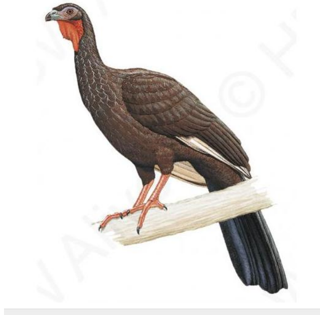
Imagen 2. Pava aliblanca ( P. albipennis )