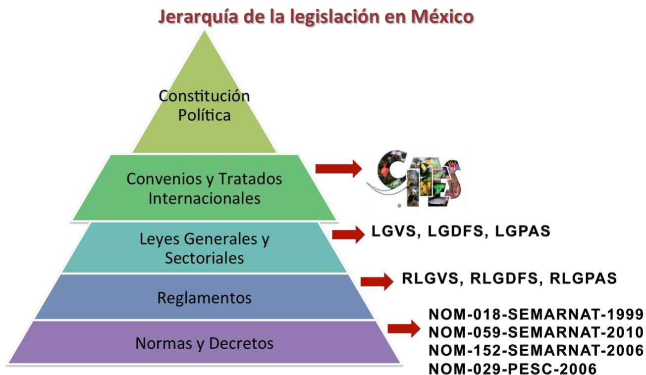
Figura 1.- Esquema de la jerarquía jurídica en México con respecto a la CITES.

México se adhiere a la CITES hasta 1991. Al ser un tratado internacional jurídicamente vinculante, se ubica por debajo de la constitución y por encima de las leyes generales y sectoriales en la jerarquía jurídica de nuestro país ( Figura 1 ).