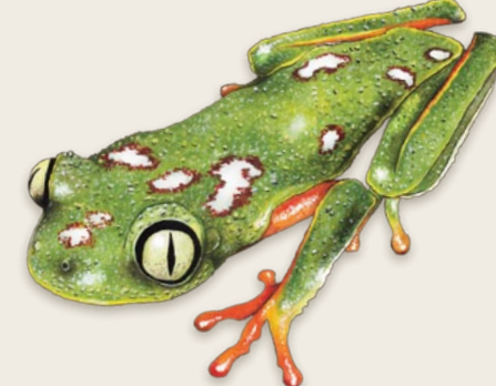
Rana arborícola Agalychnis aspera Brasil