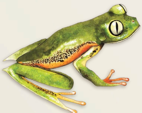
Rana arborícola Agalychnis danieli Colombia