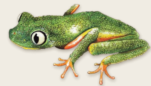
Rana arborícola Agalychnis granulosa Brasil