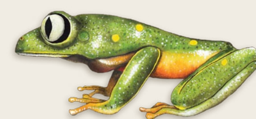
Rana arborícola Agalychnis medinae Venezuela