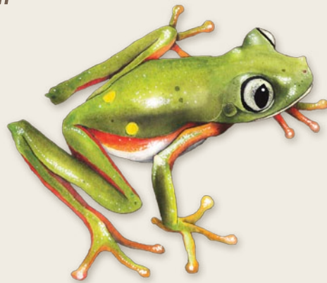
Rainette arboricole Agalychnis psilopygion Colombie et Équateur