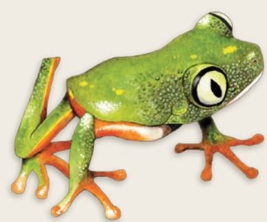
Rainette arboricole Agalychnis hulli Équateur et Pérou

Les grenouilles suivantes pourraient ressembler à celles illustrées ci-dessus mais un permis de la CITES n'est pas requis pour le commerce international de ces espèces