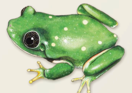
Rainette du Mexique Agalychnis dacnicolor Mexique