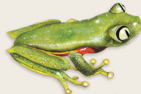
Rainette arboricole Agalychnis buckleyi Colombie et Équateur