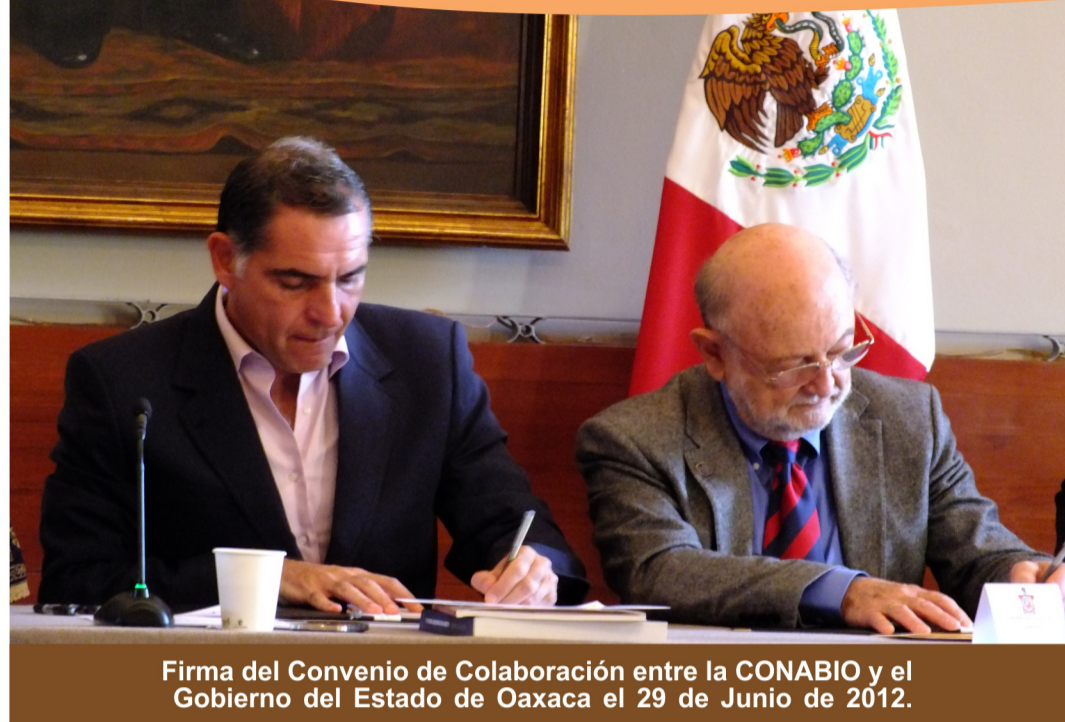
Firma del Convenio de Colaboración entre la CONABIO y el Gobierno del Estado de Oaxaca el 29 de Junio de 2012.

“Oaxaca, el estado con mayor diversidad biológica y cultural.”