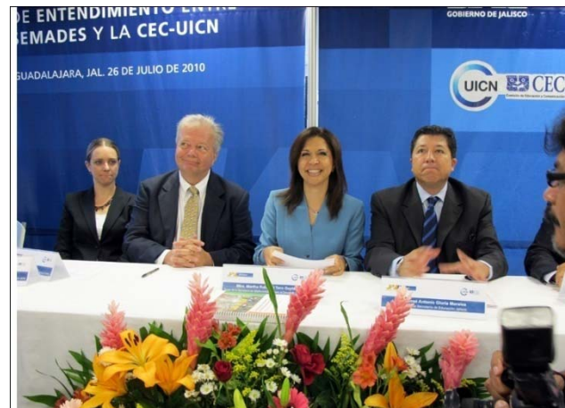
Primer Encuentro Nacional sobre Estrategias de Biodiversidad Agosto 2010 • Chapala, Jalisco.