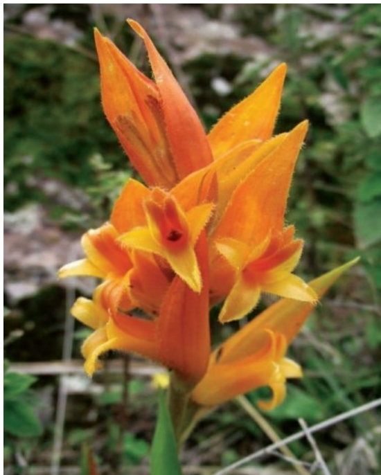
Orquídea naranja ( Dichromanthus aurantiacus ). Se aprecia la forma de la flor asociada a la polinización por colibríes.

Asimismo, se presenta información acerca de la genética de la lagartija Aspidoscelis gularis , cuyo análisis mostró la existencia de 12 variantes genéticas o haplotipos, que forman tres grupos congruentes con las zonas muestreo (al noroeste del estado, al centro y al noreste), y que se encuentran estrechamente relacionados con las lagartijas que se distribuyen en estados vecinos (Ciudad de México, Querétaro y San Luis Potosí), por lo que, para hacer propuestas de conservación, es necesario evaluar en conjunto todas estas poblaciones del centro del país. Incluso algunos de los resultados sugieren la existencia de especies aún no descritas para la entidad, por lo que es necesario continuar con los estudios.