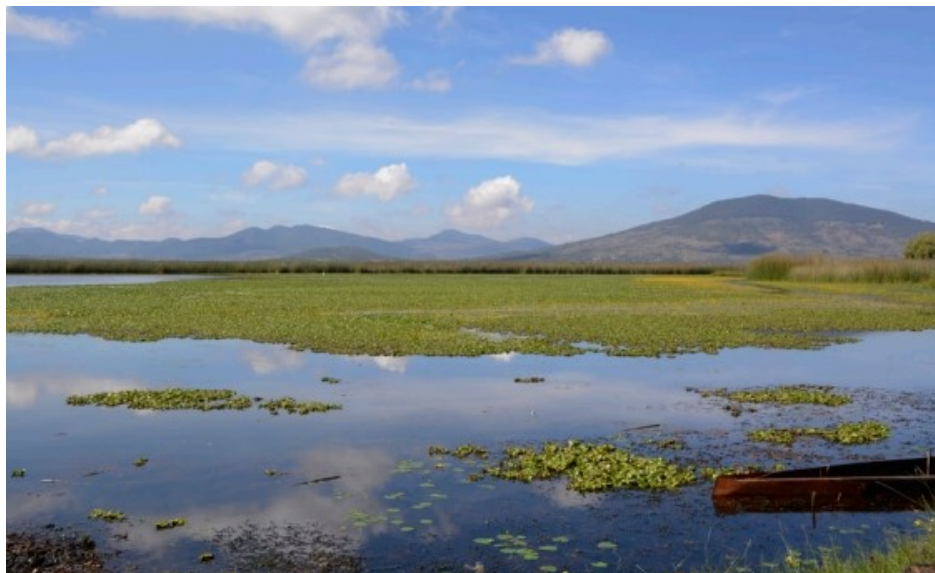
Laguna de Tecocomulco.

En síntesis, el territorio hidalguense presenta 27 tipos de clima, 17 clases de suelo principales y 45 diferentes categorías para uso del suelo y vegetación.