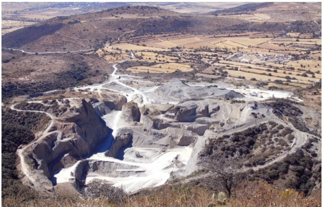
Mosaico de paisajes naturales e intervenidos por actividades mineras para extracción de arena azul en el Zempoaltépetl.

La zona metropolitana de Pachuca se localiza al sur del estado en una zona de pie de monte que tiene un clima seco/semiseco. La superficie actual de esta zona metropolitana es de 34.1 km 2 y se estima que entre 1983 y 2015 aumentó en 15 km 2 ; es decir, su superficie aumentó alrededor de 50%. Pachuca como fenómeno urbano se expande sobre la zona de transición entre el paisaje xerófilo (región Xerofítica mexicana) y el paisaje templado boscoso de la Sierra Madre Oriental.