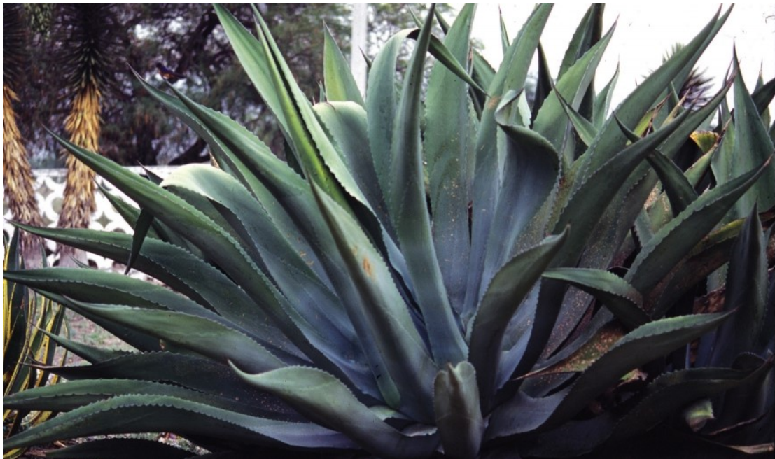
Ejemplar de maguey pulquero ( A. salmiana ).

Algunos felinos ( Herpailurus yagouaroundi , Leopardus pardalis , L. wiedii , Lynx rufus y Puma concolor ) y el coyote ( Canis latrans ) son cazados furtivamente por su valor ornamental. Hay mamíferos que son considerados perjudiciales para el ser humano, porque afectan el ganado, las aves de corral y los cultivos, como el mapache ( Procyon lotor ), la zorra ( Urocyon cinereoargenteus ), y el cacomixtle ( Bassariscus astutus ); a otros se les atribuyen poderes especiales y se sacrifican para fabricar amuletos de la suerte, como el conejo ( Sylvilagus floridanus ). También se usan con fines medicinales, como el tlacuache ( Didelphis marsupialis y D. virginiana ) y los zorrillos ( Conepatus leuconotus , Mephitis maccroura , Spilogale gracilis ).