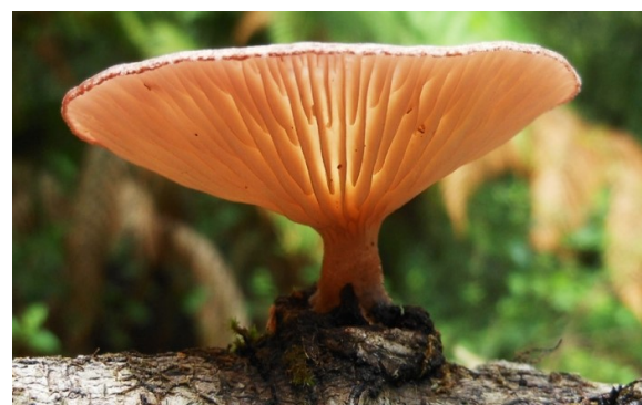
Hongo cuerudo ( Panus conchatus ).

Área de forrajeo de una colonia de maternidad del murciélago maguero mayor ( Leptonycteris nivalis ) en el centro de México