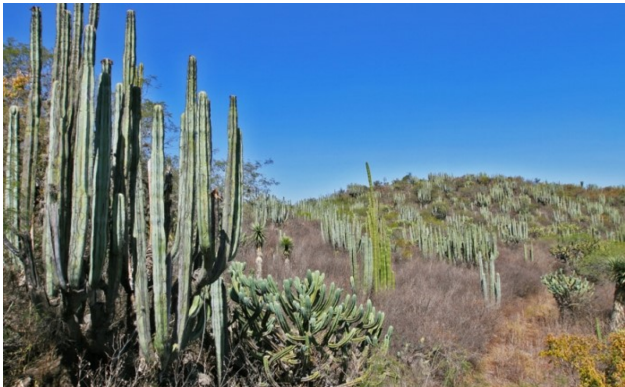
Matorral xerófilo en la barranca de Metztitlán.