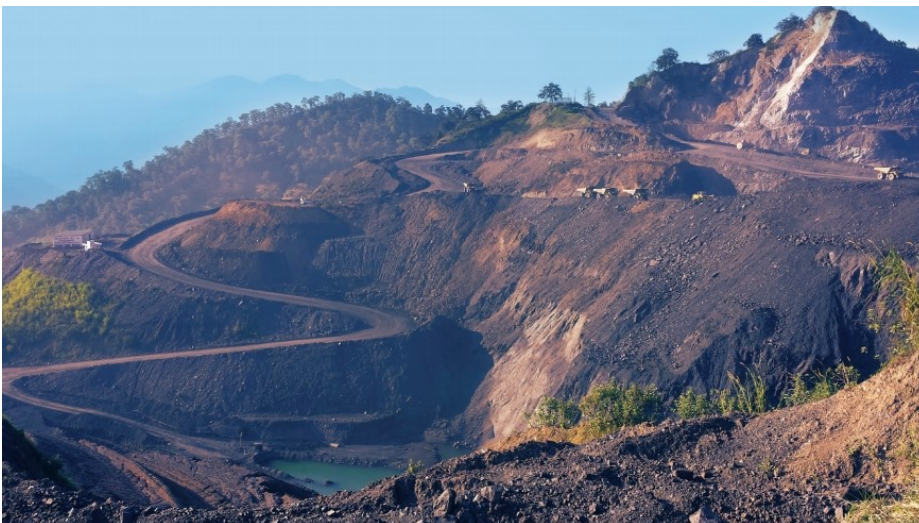
Tajo minero Naopa, distrito minero Molango.

La construcción de más rellenos sanitarios es un tema complejo. Si bien esta infraestructura es necesaria, su manejo inadecuado genera daños a la salud y provoca que los pobladores frecuentemente se opongan a la construcción dentro de sus territorios. Sin embargo, es un tema pendiente de resolver, ya que la actual infraestructura está sobrecargada. Cada día se producen 2 804 t de basura –sobresale la capital estatal que genera casi una cuarta parte del total– y sólo se recicla 2.4%. Sumado a eso, la capacidad de recolección en la entidad es de 89.3% en promedio y 57% de los residuos no llegan a rellenos sanitarios.