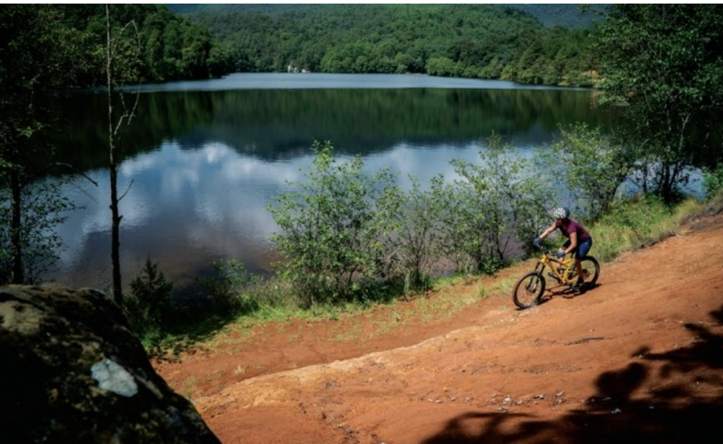
Actividades de ecoturismo que se practican en el Rancho Santa Elena.

Es importante aclarar que, hasta hace poco, se presentaban amplios vacíos en el conocimiento de la riqueza de especies de Hidalgo. Sin embargo, en 2006 la Universidad Autónoma del Estado de Hidalgo encabezó el proyecto Diversidad Biológica del Estado de Hidalgo, que sentó las bases para que en el periodo 2006 a 2016 se desarrollara la ardua labor de inventariar la biodiversidad del estado, y permitió ubicar a la entidad dentro de los quince primeros lugares a nivel nacional en este rubro, determinándose que Hidalgo posee una importante variedad de especies de plantas, animales y hongos.