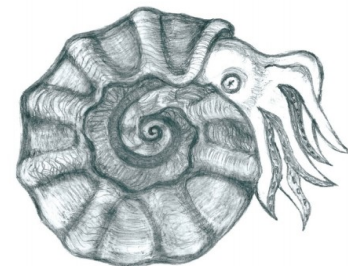
Aspecto general de un amonite. Ilustración: Kinardo Flores.

Con La biodiversidad en Hidalgo. Estudio de Estado se completa un diagnóstico actualizado del capital natural del estado, así como las capacidades institucionales en la entidad, que permite comprender el entorno físico, social y biológico a mayor detalle, por lo que esta obra puede constituirse como una referencia valiosa para el diseño de las acciones y estrategias, que aseguren la conservación, el uso racional y sostenido de la diversidad biológica a través de la implementación de la Estrategia para la Conservación y el Uso Sustentable de la Biodiversidad del estado de Hidalgo .