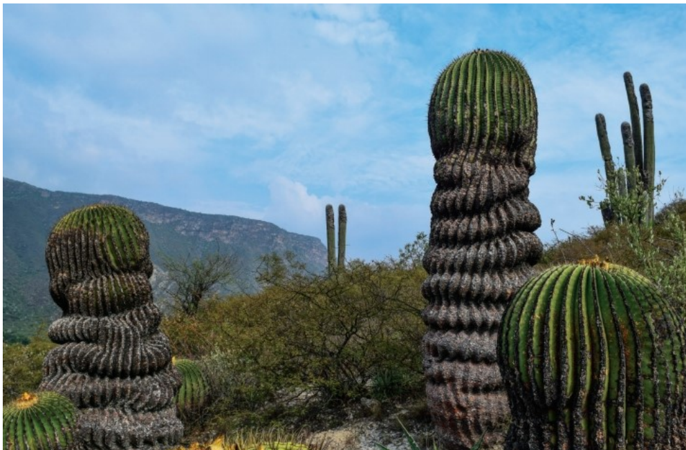
Echinocactus platyacanthus en la Reserva de la Biosfera Barranca de Metztitlán.

Con respecto a instrumentos de política pública, destaca el Programa de Gestión para Mejorar la Calidad del Aire del Estado de Hidalgo (ProAire), el cual es una respuesta a la preocupación de los gobiernos ante los riesgos ambientales y efectos en la salud de las personas, vinculados a la calidad del aire. Las estrategias están dirigidas fundamentalmente a reducir las emisiones provenientes de fuentes móviles (p.e. programa de verificación vehicular obligatorio, diagnóstico ambiental automotriz, impulso de la movilidad integral en el estado), de fuentes fijas (p.e. plan de emisiones industriales, aprovechamiento de residuos, modernización de plantas de generación eléctrica) y de fuentes de áreas (p.e. involucra al sector ladrillero, los residuos sólidos urbanos y de manejo especial, la quema agrícola e incendios forestales, el uso del recurso solar y las eco-tecnologías). También buscan impulsar el fortalecimiento institucional con un sistema de monitoreo atmosférico en el estado, un inventario de emisiones y un programa de educación ambiental.