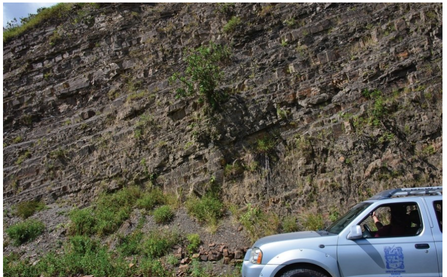
Rocas fosilíferas de la formación Huayacocotla.

Los peces fósiles de Hidalgo están representados por organismos dulceacuícolas y marinos. El grupo mejor representado es de los peces osteíctios con 22 especies, aunque también existen registros de peces condriictios (tiburones y rayas) y sarcopterigios.