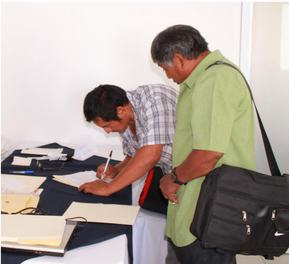
Registro de participantes

Los trabajos se postergaron por tres horas a fin de esperar a miembros de las organizaciones que viven en comunidades alejadas de la sede del taller. El programa dio inicio a las 12 del día modificando su contenido y el horario de sus actividades. De esta manera se canceló la presentación "El ABC de la Economía Social y el INAES" y se ajustaron los tiempos de los siguientes temas.