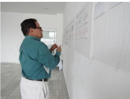
Construyendo indicadores de evaluación

Después del trabajo en mesas, cada equipo presentó a la plenaria las tarjetas que describen sus indicadores de evaluación y revisan en diálogo con el facilitador, quien explicó la necesidad de relacionar la construcción de indicadores, con los objetivos de la organización.