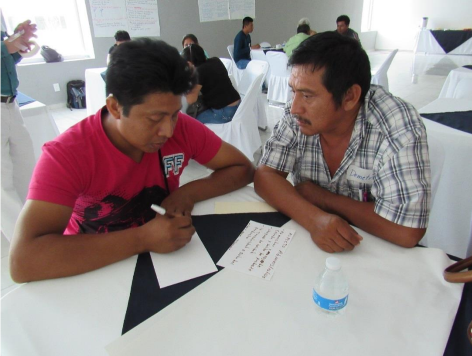
Trabajando por equipos

Después del trabajo en mesas, cada equipo presentó a la plenaria las tarjetas que describen sus indicadores de evaluación y revisan en diálogo con el facilitador, quien explicó la necesidad de relacionar la construcción de indicadores, con los objetivos de la organización.