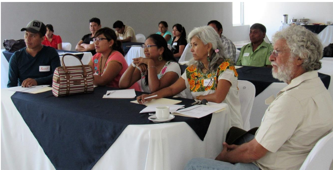
Presentación de los participantes