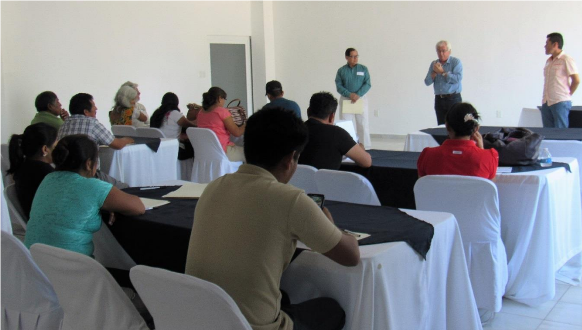
Presentación e Inauguración

Se presentaron las reglas y acuerdos que rigen el taller